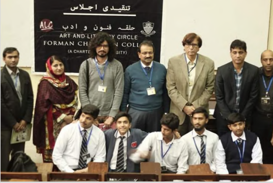
A group photo after the session.

تدریسی سال کے دوران طلباء میں تخلیقی و تنقیدی صلاحیتوں کو فروغ دینے کے لیے ہفتہ وار "ادبی تنقیدی اجلاس" کا اہتمام کیا گیا۔ جن میں انٹر میڈیٹ کے طلباء نے غزلیات، منظومات، افسانوں اور تراجم پر مبنی فن پارے پیش کیے۔ صدارت کرنے والی اہم شخصیات میں ڈاکٹر اختر شمار، ڈاکٹر نجیب جمال اور پرفیسر طاہر مسعود شامل ہیں۔