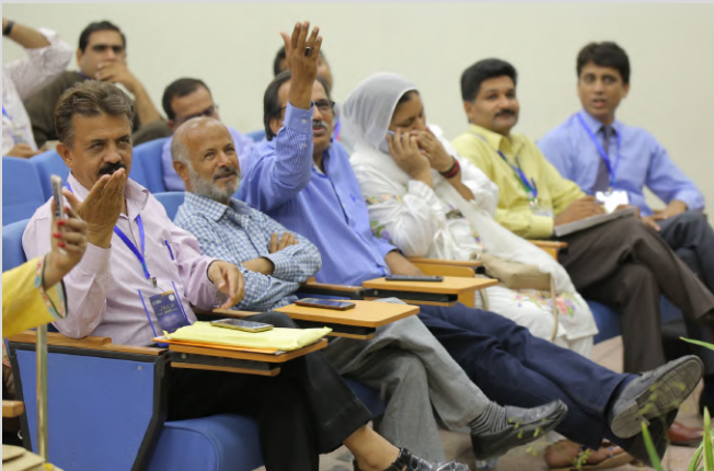
The Faculty & Audience are getting amused with poetry.