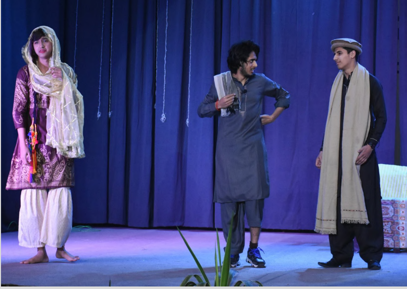
Students are performing in ALC Annual Play