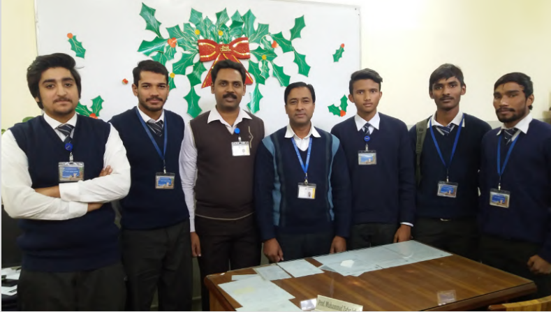
FCC Intermediate Free Book Bank Faculty & Student body.