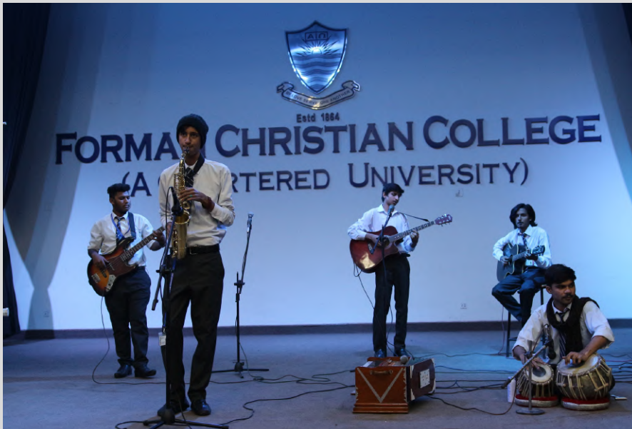
ALC Musical Band is performing.

سپرنگ فی ایسٹا موسم بہار میں ادب اور فنون لطیفہ سے مزین سرگرمیوں پر مشتمل ایک رنگا رنگ پروگرام ہے۔ سپرنگ فی ایسٹا 2018-19 میں درج ذیل پروگراموں کا اہتمام کیا گیا جن کی میڈیا کوریج "لاہور رنگ" اور "سٹی 42" ٹی وی چینلز نے کی۔